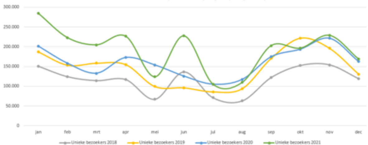
Unieke bezoekersstatistieken studiekeuze123.nl per maand over jaren 2018-2021

Vooraf in de eerste helft van 2021 waren er veel meer bezoekers in vergelijking met de jaren daarvoor. Dit lijkt een logisch gevolg van het thuisonderwijs tijdens de coronapandemie en het gebrek aan fysieke studiekeuzevoorlichting in die periode. De studiekeuzeoriëntatie vond voornamelijk online plaats en studiekeuze123.nl bleek een vaak geraadpleegde bron.